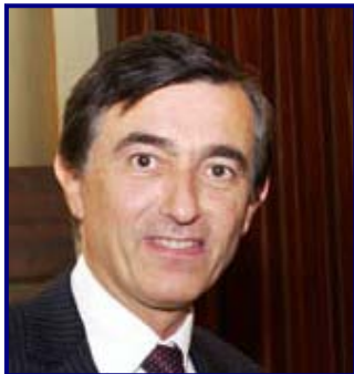
Monsieur Philippe Douste-Blazy Ministre de la Santé et de la Protection Sociale