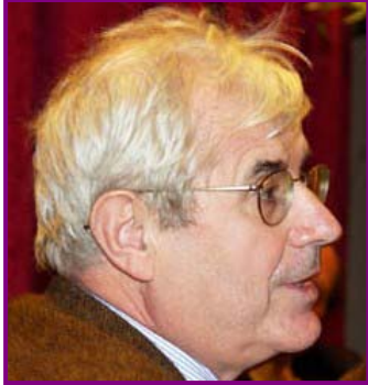
Hervé Le Bras

Démographe et directeur d'études à l'Ecole des Hautes études en Sciences Sociales